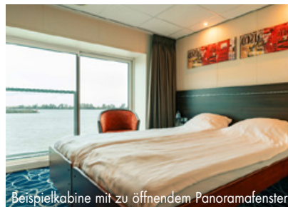
Beispielkabine mit zu öffnendem Panoramafenster